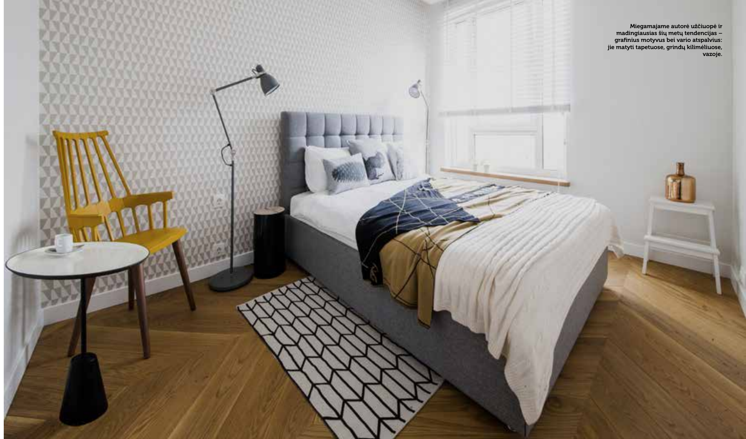
Miegamajame autorė užčiuopė ir madingiausias šių metų tendencijas – grafinius motyvus bei vario atspalvius: jie matyti tapetuose, grindų kilimėliuose, vazoje.