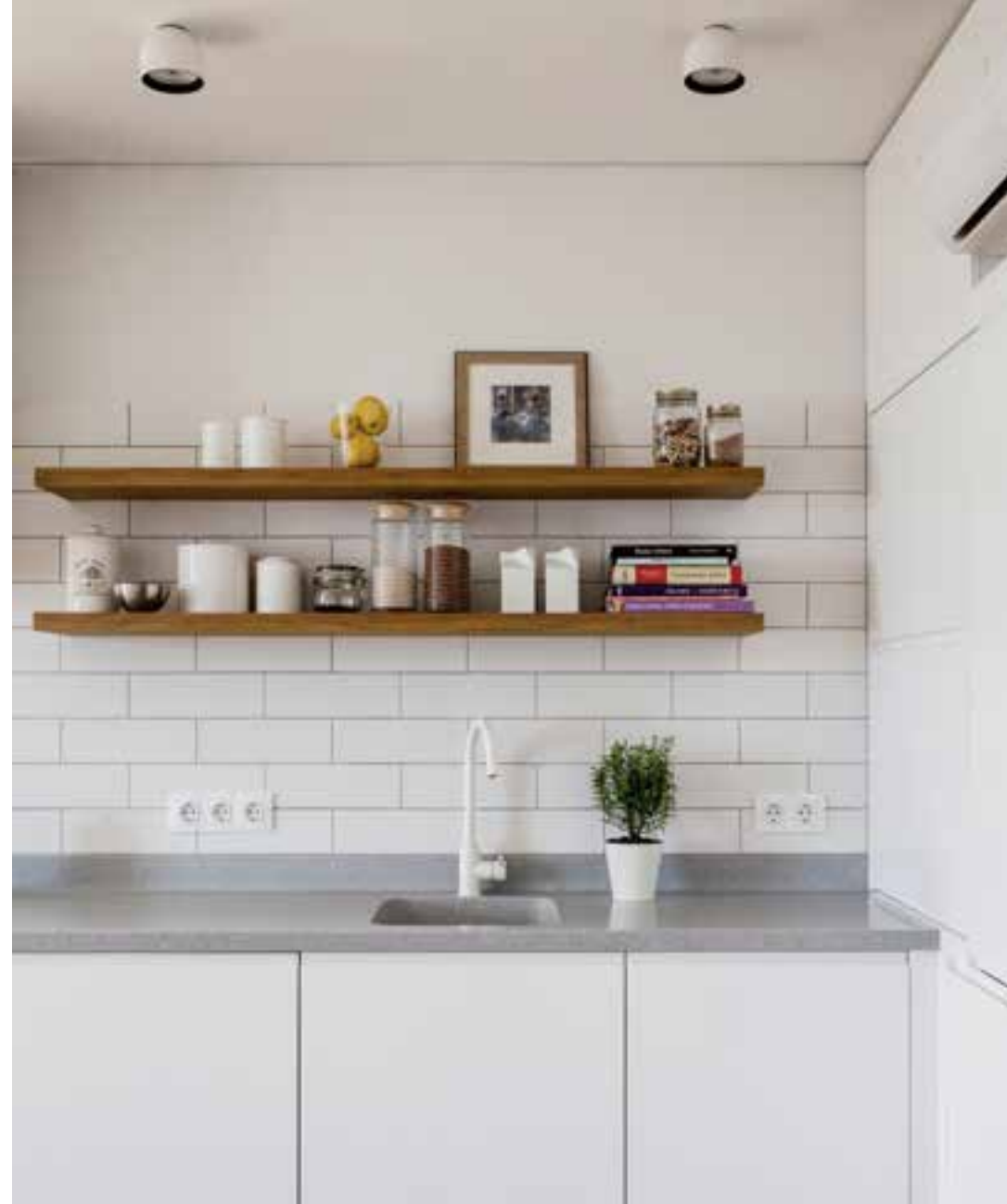
Virtuvės baldai, lentynos, indauja, ūkinės spintos, vonios baldai pagaminti įmonės „Evaldo baldai“ meistrų.