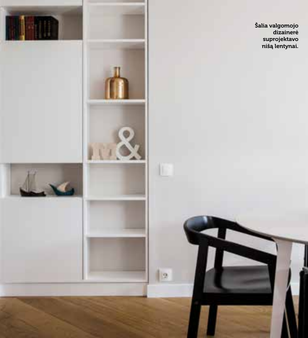
Šalia valgomojo dizainerė suprojektavo nišą lentynai.