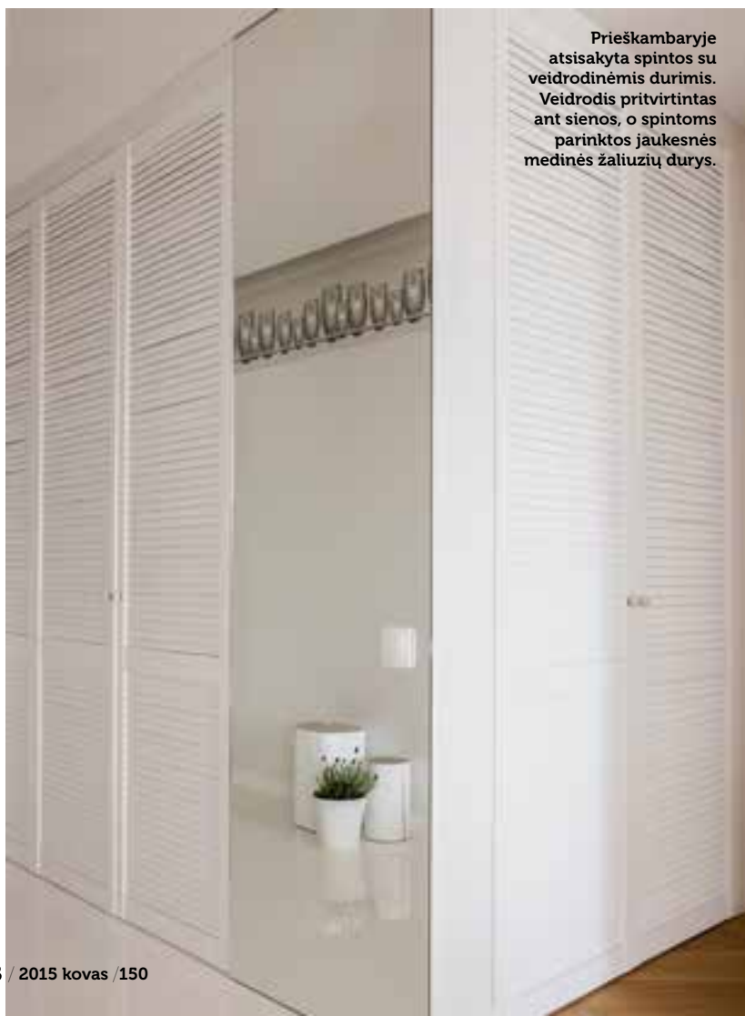
Prieškambaryje atsisakyta spintos su veidrodinėmis durimis. Veidrodis pritvirtintas ant sienos, o spintoms parinktos jaukesnės medinės žaliuzių durys.

Interjere dominuoja miško tema geriausiai atskleidžiančios detalės. Ažuolinės lentos, suklotos klasikiniu eglutės raštu, primena šią apinką ir tampa subtilia užuomina į klasiką. Prieškambaryje ant sienos atsirado tapetų fragmentas su pelėdomis. Miško temą tęsia ir kelmiai-staliukai. Net plastikinės palangės buvo pakeistos ažuolinėmis. Atsikleisti subtiliems interjero elementams padeda neutralus baltas fonas. Jame išryškėja iš kiek neįprasto mangų medžio pagaminta komoda ir kavos staliukas, ažuolinės knygų lentynos, mažesnių lentynų ir medinių dėžučių – gėlių vazonų kompozicija palei langą, pinti krepšiai daiktams susidėti.